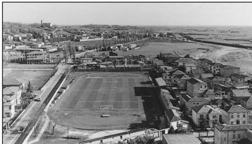
Lo stadio Romeo Menti, un'area preziosa per Montichiari.

Laddove si voglia valutare la costruzione di un nuovo stadio di calcio presso la zona adiacente al Palageorge, riteniamo che l'area "Romeo