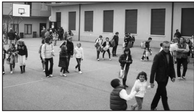
I ragazzi all'uscita della scuola.