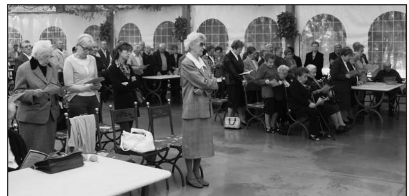
Pensionati presenti all'assemblea.

Come Patronato Inas e Fnp il Martedì dalle ore 14,00 -17,00 ed il Mercoledì e Venerdì ore 9,00-12,00; mentre il Martedì ore 17,00-19,00 la FILCA (Edili-Legno-lapidei); il Mercoledì ore 17,00-19,00 la FAI (Agricoli e alimentare) il Giovedì ore 9,00- 12,00 come Agenzia Viaggi UNITOUR.