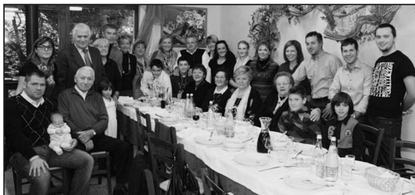
Un ricordo della bella giornata alla Sosta Napoleonica.