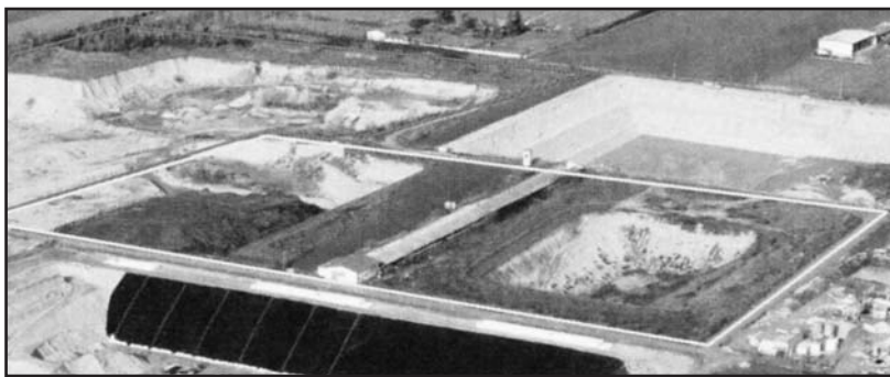
Il progetto della nuova discarica richiesto da Padana Green srl.