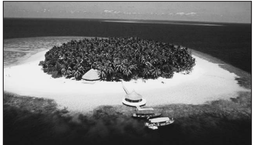
L'isola, simbolico luogo della felicità.

L'isola è il simbolico luogo della felicità, il luogo mitico, incantato e idealizzato, dove tornare per recuperare l'infanzia con i suoi sogni e le sue innocenze, il luogo dove rifugiarsi per evadere dal quotidiano, il luogo della libertà dove finalmente l'impossibile pare realizzarsi.