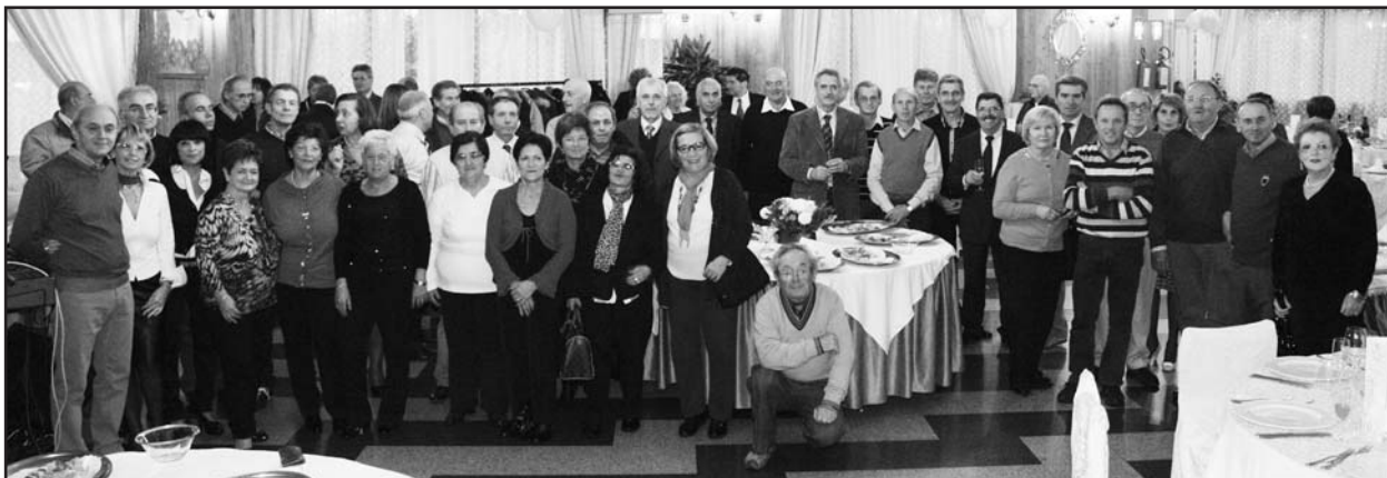
La classe 1949 al Green Park Boschetti.